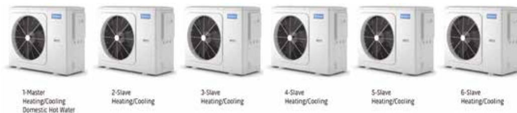
1-Master Heating/Cooling Domestic Hot Water

Gestione in cascata fino a 6 unità. Potenza impianto fino a 96 kW.